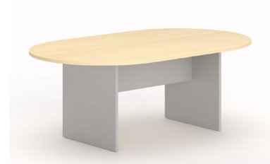
TABLE DE REUNION PATEAU CHENE MOYEN :