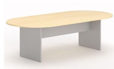
TABLE DE REUNION PATEAU CHENE MOYEN :