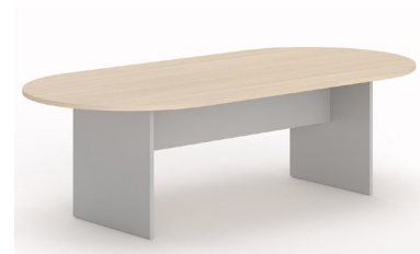
TABLE DE REUNION PATEAU POIRIER :