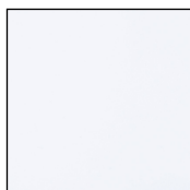
Blanc RAL 9016